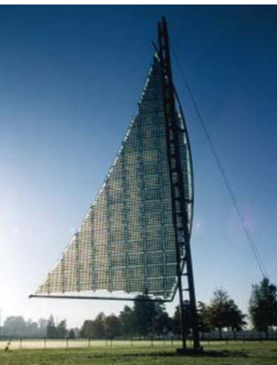
Das Sonnensegel in Münsingen

Im Sommer 2005 wird zudem auf einem Schulhausdach eine neue Photovoltaik-Anlage gebaut, welche zusätzliche 19'000 kWh Strom für die Ökostrombörse produzieren wird.