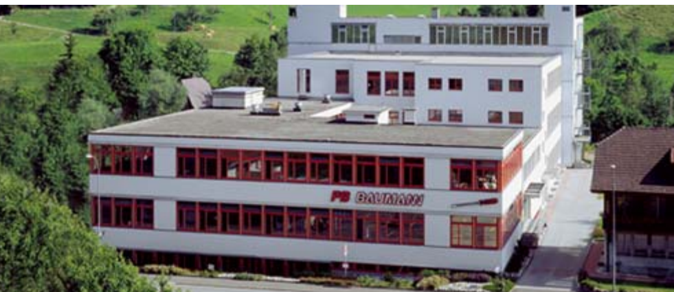
Der Hauptsitz der PB Baumann GmbH in Wasen

FSC (Forest Stewardship Council) Das FSC-Zertifikat garantiert Holz aus umwelt- und sozialverträglich bewirtschafteten Wäldern