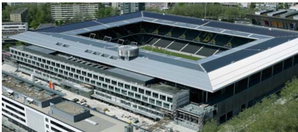
Flugansicht des Stade de Suisse Wankdorf Bern mit integriertem Sonnenkraftwerk und Info- und Meetingcenter «SOLEIL».

Damit erweitert die BKW ihre Ökostrompalette und baut ihre schweizweit führende Stellung als Ökostrom-Produzentin weiter aus.